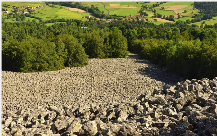
La coulée de lave (Christian BERTHOLET)