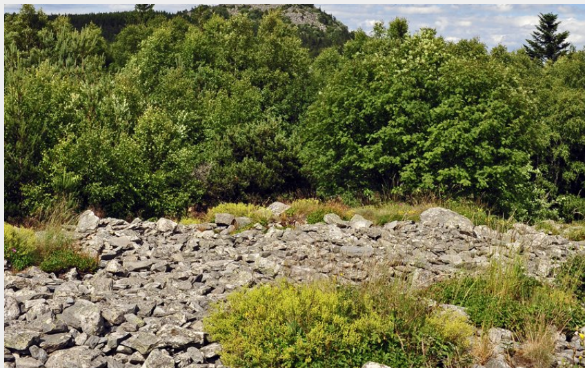
Pierrier en Meygal (Ch. Bertholet)