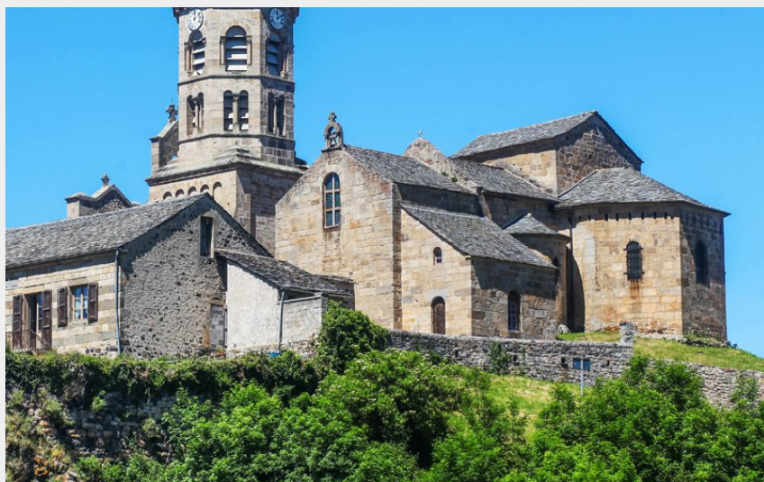
L'église de Saint-Julien-Chapteuil (David Frobert)