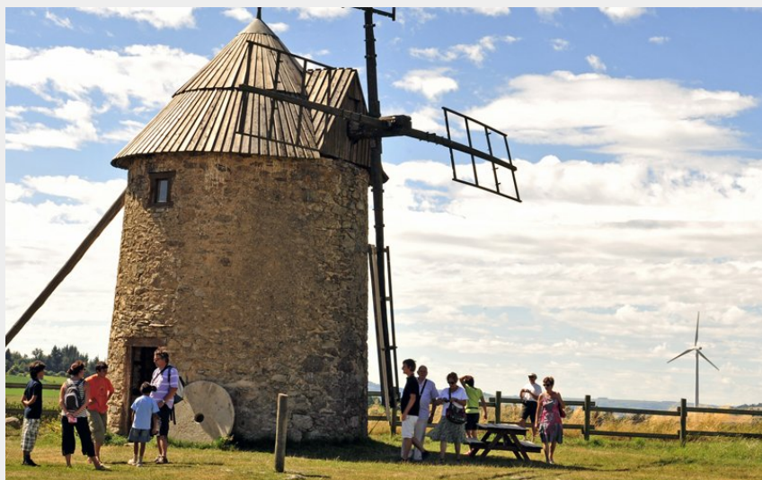
Moulin d'Ally (Ch. Bertholet)