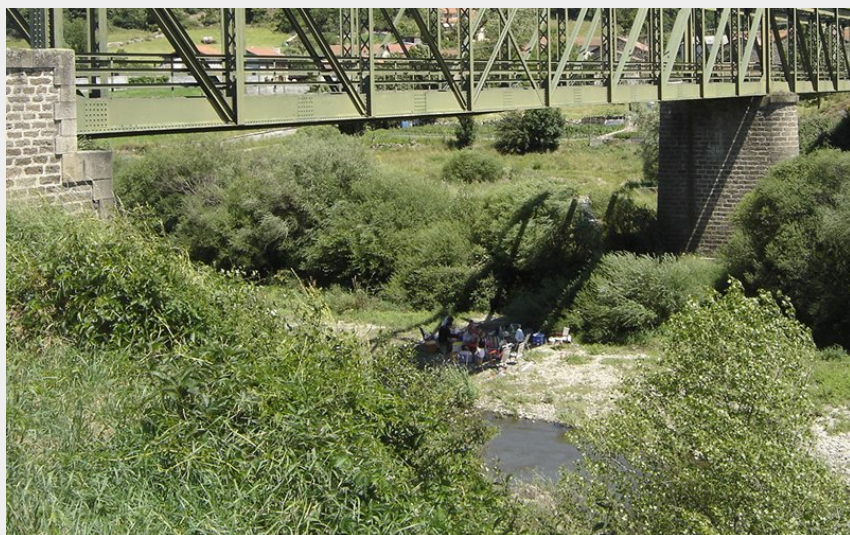
Pont de Changeac (Christian Bertholet)