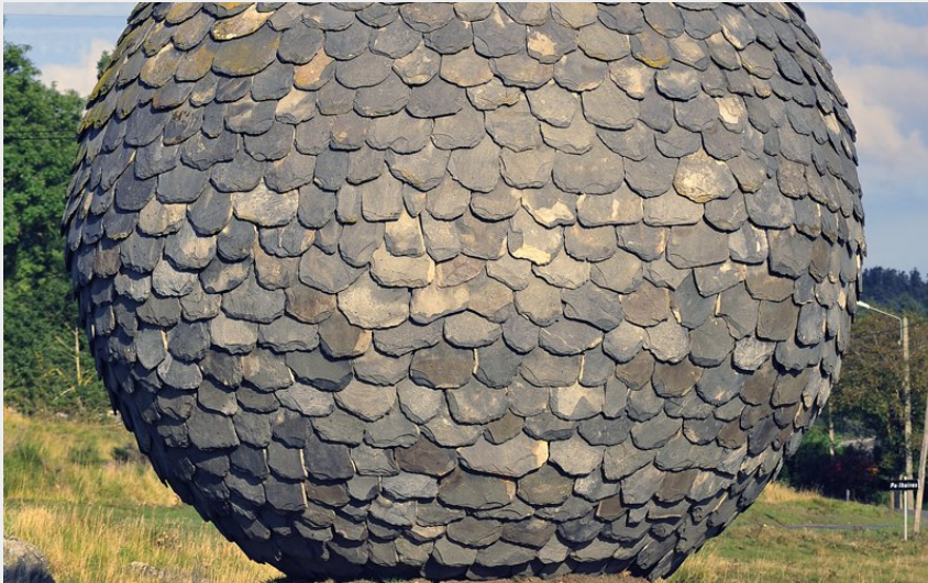
La sphère de Lauzes de Pailhaires (Christian Bertholet)