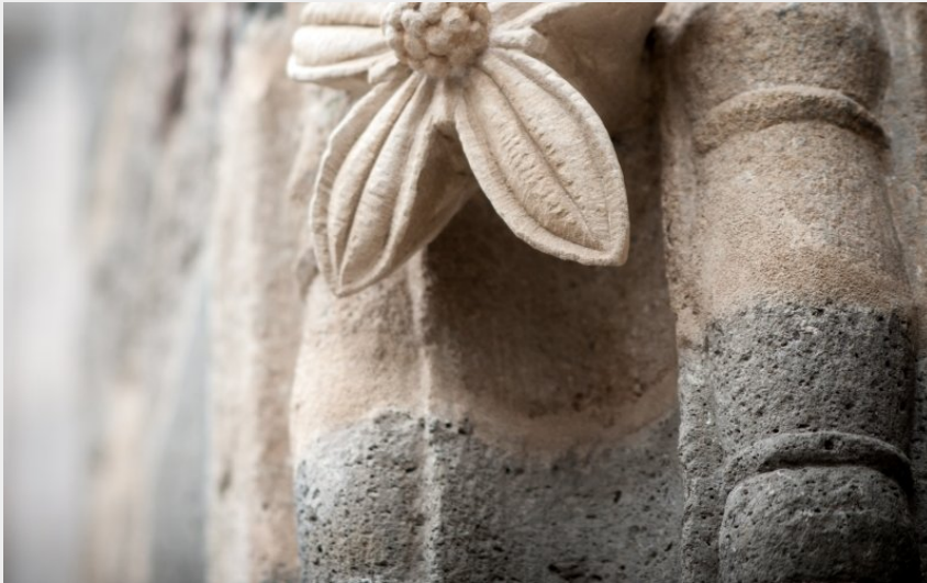
Eglise de Blesle (Jérémy Mazet)