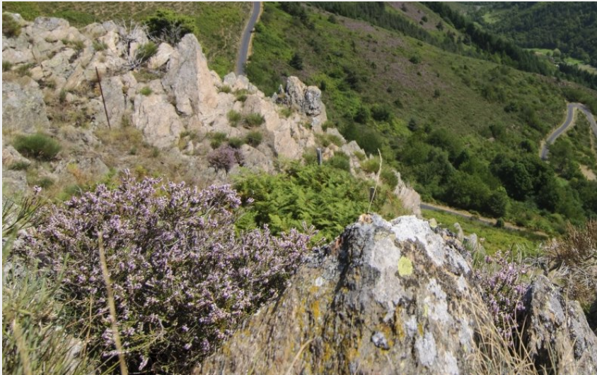
Paysage entre Desges et Lesbinières (Jérémy Mazet)