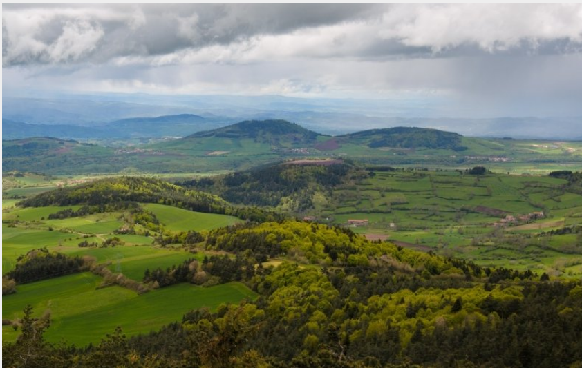
Vue de la Durande (Jérémy Mazet)