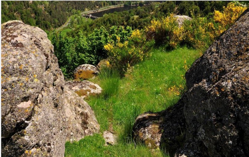
St-Préjet-d'Allier (Jérémy Mazet)