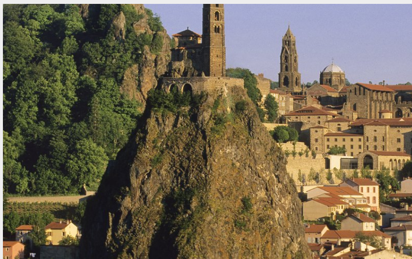
Le Puy-en-Velay