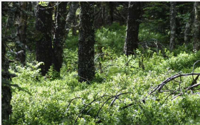
En forêt (Jérémy Mazet)