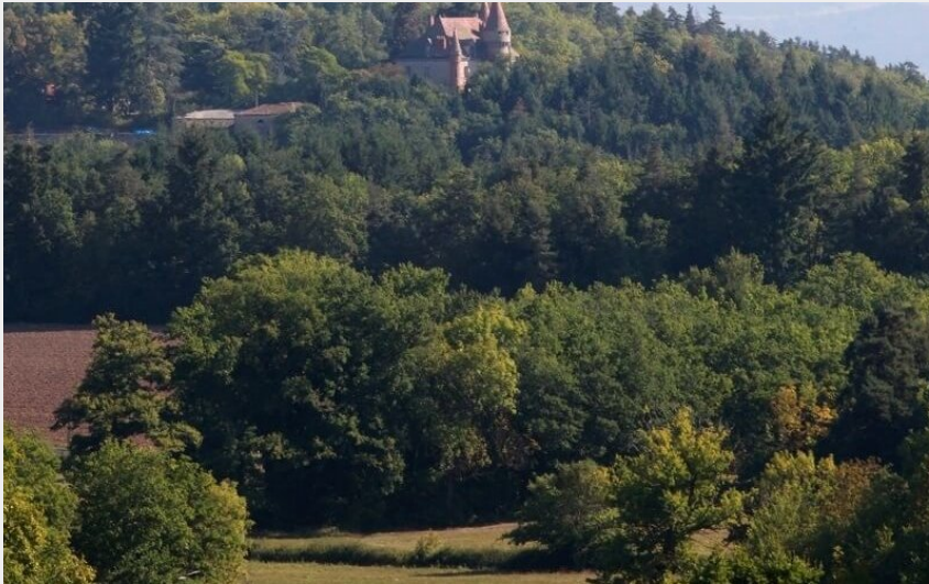
Château de la Chomette (L. Barruel)