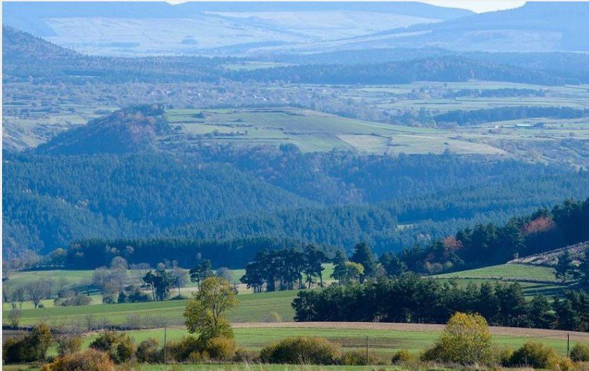
Le Mézenc depuis le Marais de la Sauvetat (Jérémié Mazet)