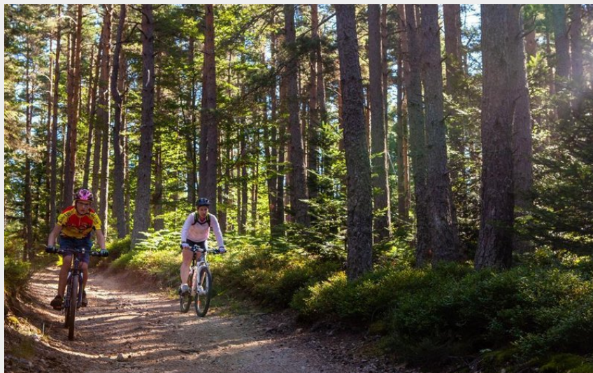
circuit vtt les 3 ponts (Fabrice Beauvois)