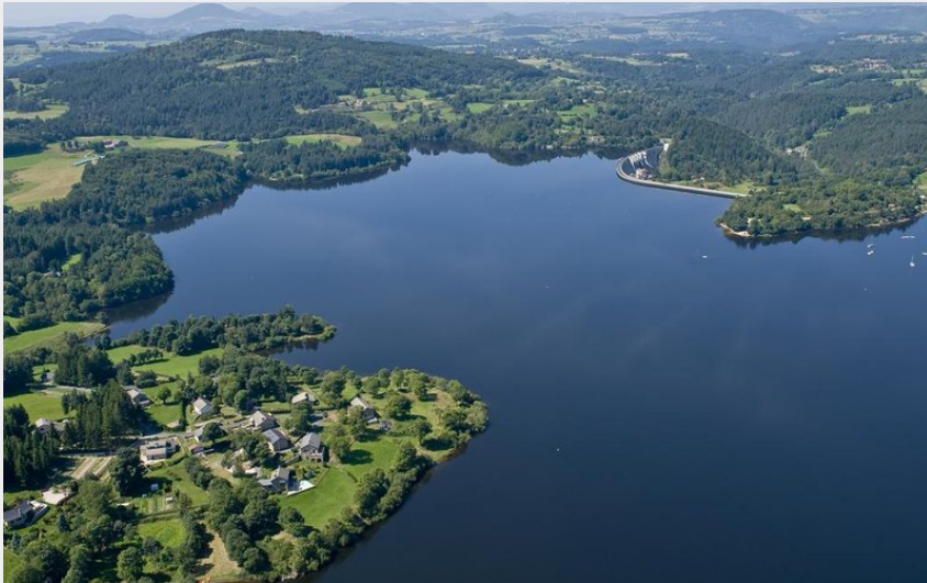
Le barrage de Lavalette (Luc Olivier)