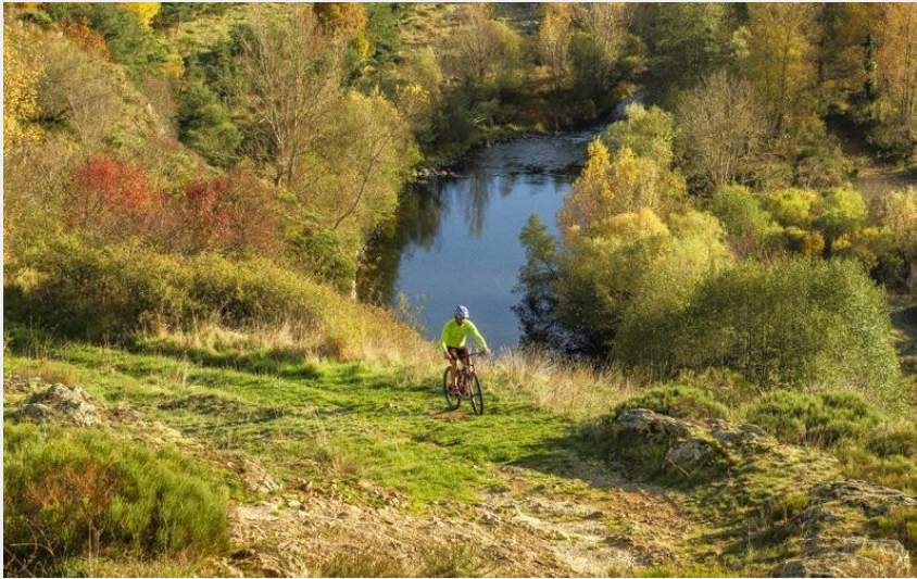
Sur les chemins de l'aventure (Luc Olivier)