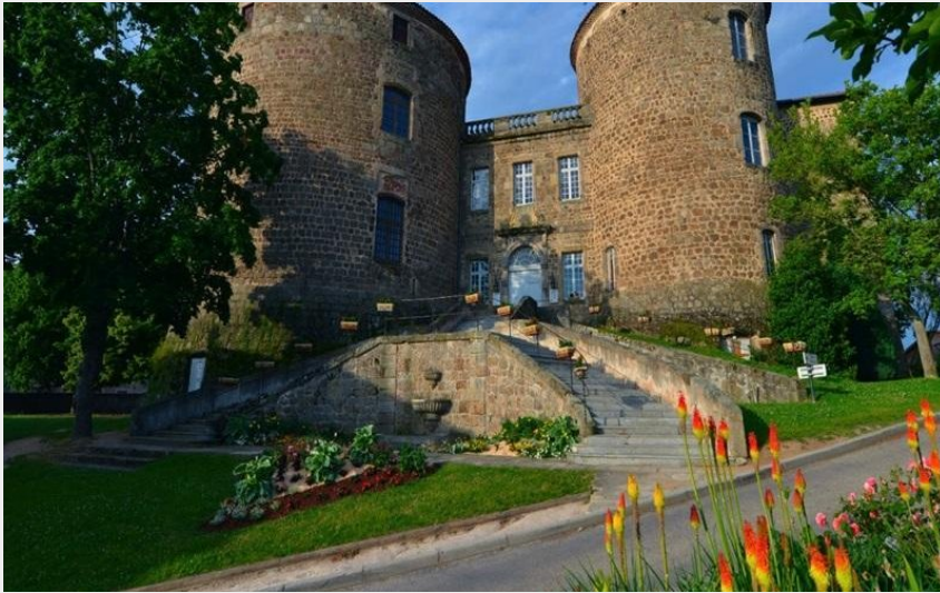
Le Château des Evêques à Monistrol-sur-Loire (Jean-Claude PARAYRE)