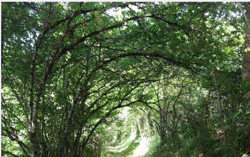
Au coeur de la forêt (Mélissa Tessier)