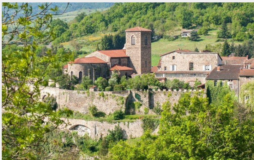
Vue sur l'église de Vieille-Brioude (Jérémie Mazet)