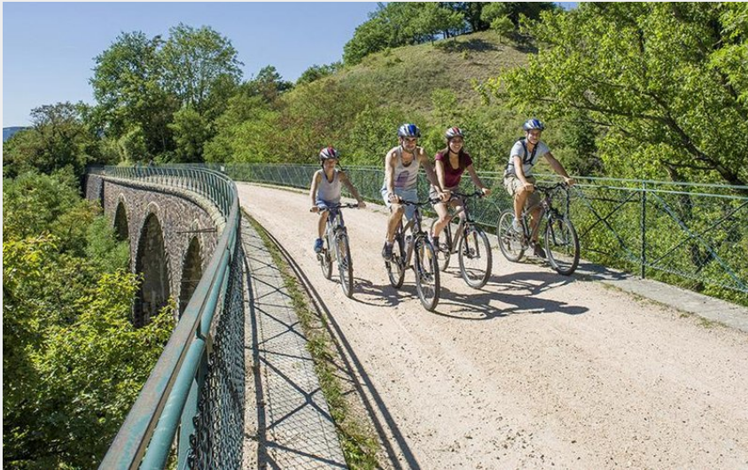
Sur le parcours de La Galoche à Rosières (Luc Olivier)