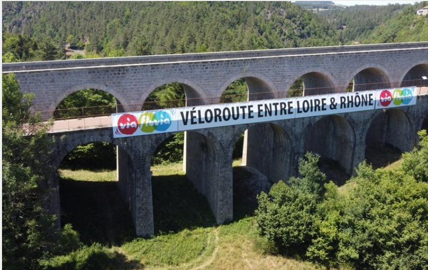
Via fluvia - Véloroute entre Loire & Rhône