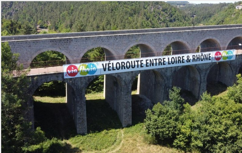
Via fluvia - Véloroute entre Loire & Rhône (Luc Olivier)