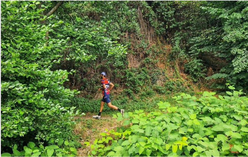
Trail à Auzon