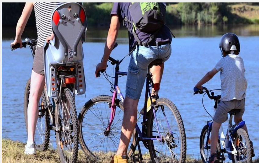
Balade en famille (Jean-Claude PARAYRE)