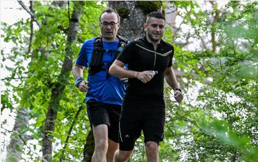
Entre Chadieu et Andrable (JC Parayre)