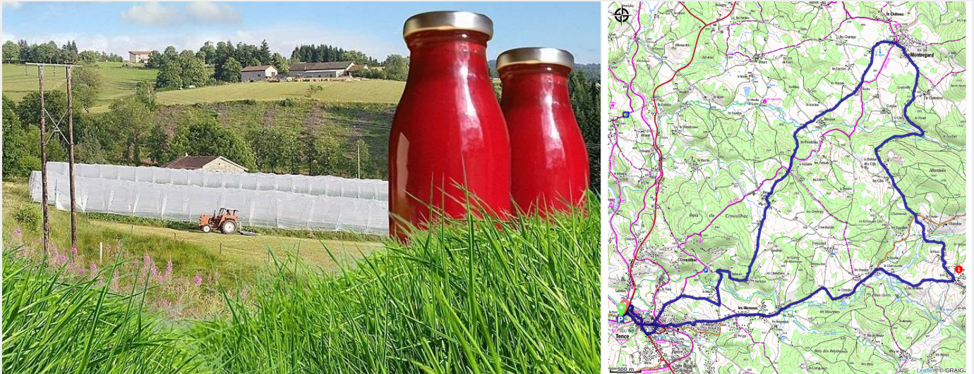
Maison Rouge framboise