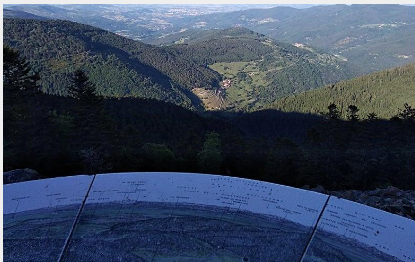
Pause panoramique