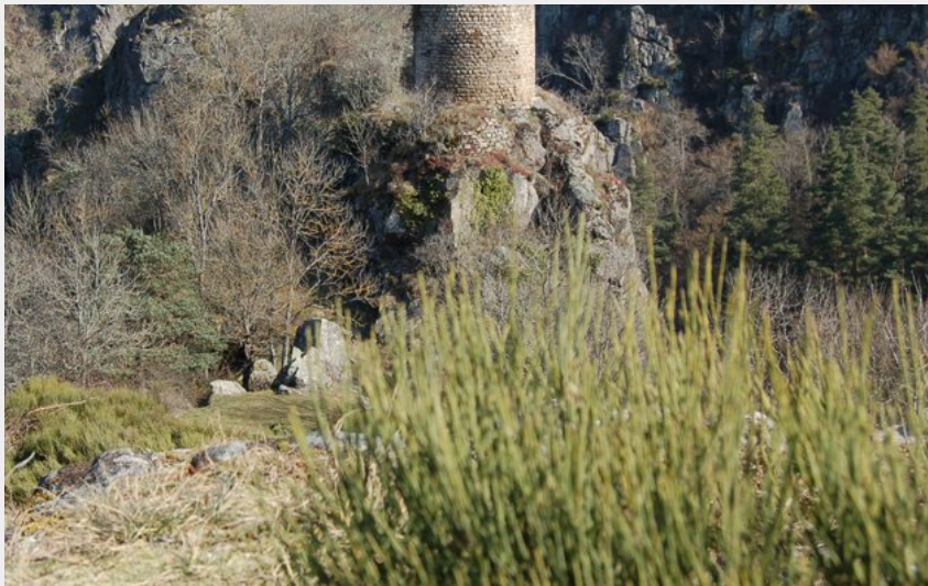
La Tour d'Oriol (CC Loire Semène)