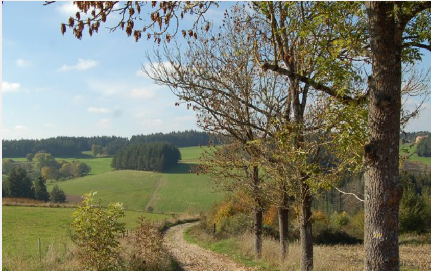
En chemin (CC Loire Semène)