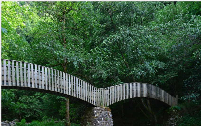
La Passerelle de la Tour (Jean-Claude Parayre)