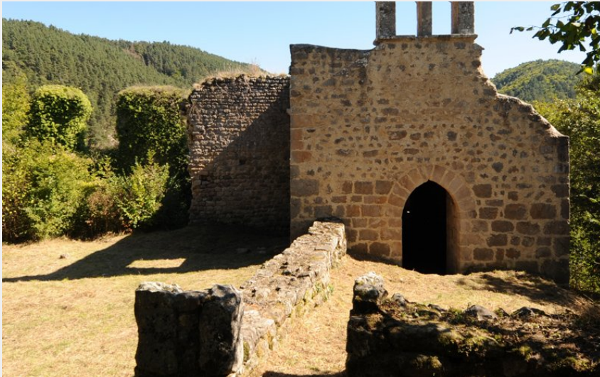
Chapelle du Fraisse (Jean-Claude Parayre)