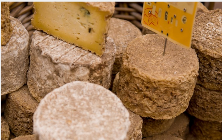
Fromages aux artisans (J. Mazet)