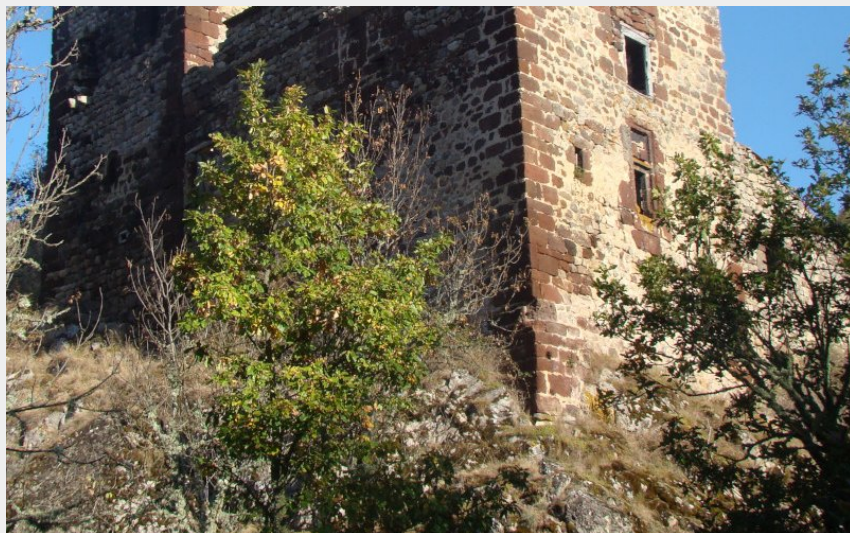
Château d'Agrain (J. Mazet)