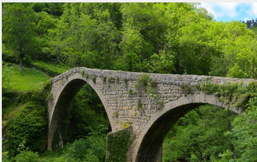
Le pont du Diable (Jean-Claude Parayre)