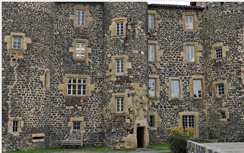
Le Monastier-sur-Gazeille, le château (Christian Bertholet)