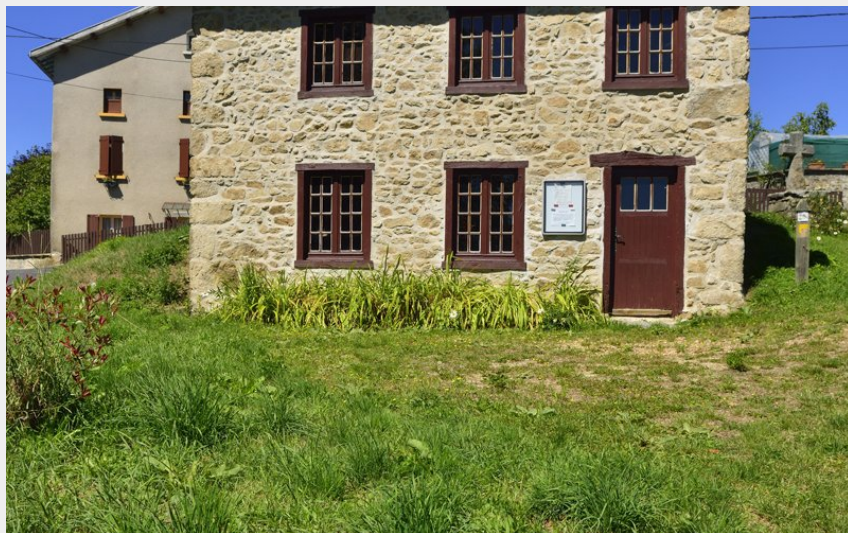
Maison de béate de Cheyrac (P Bousseaud)