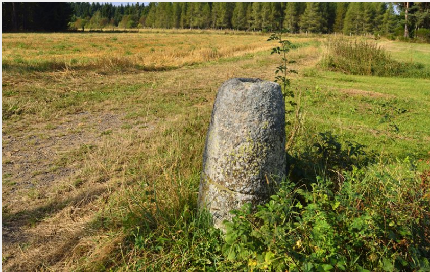
Borne milliaire (P Bousseaud)