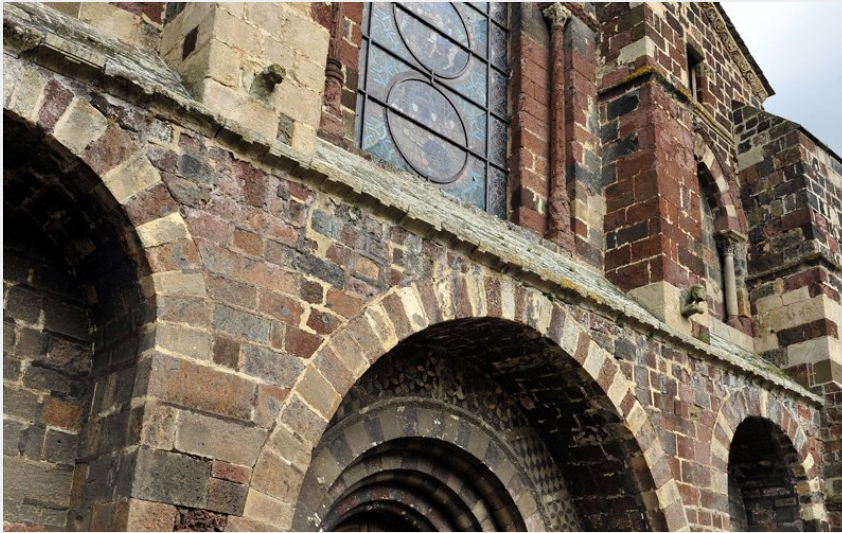
Eglise abbatiale Saint Théofrède (Christian BERTHOLET)