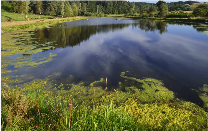
Plan d'eau d'Argentières (P Bousseaud)