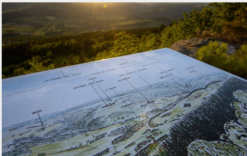
Vue depuis le plateau de la Madeleine (Jérémy Mazet)