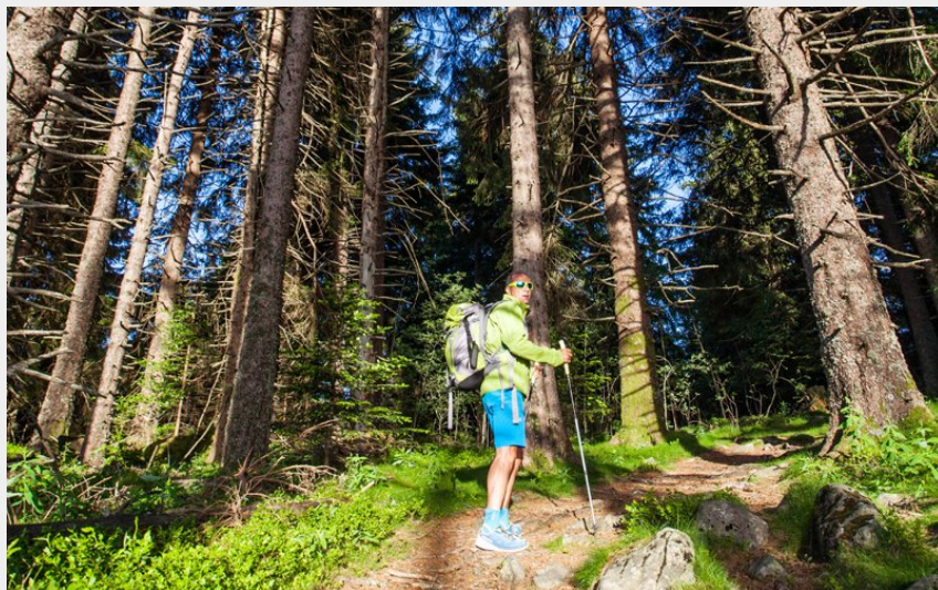
Balade dans le Meygal (David Frobert)