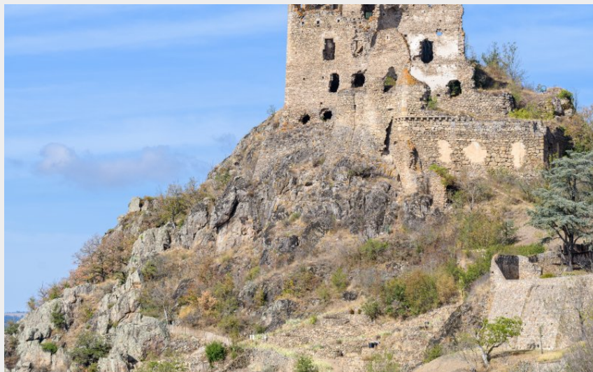
Château de Léotoing (Jérémy Mazet)