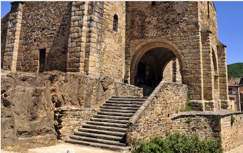
La collégiale Saint-Laurent d'Auzon (Christian BERTHOLET)