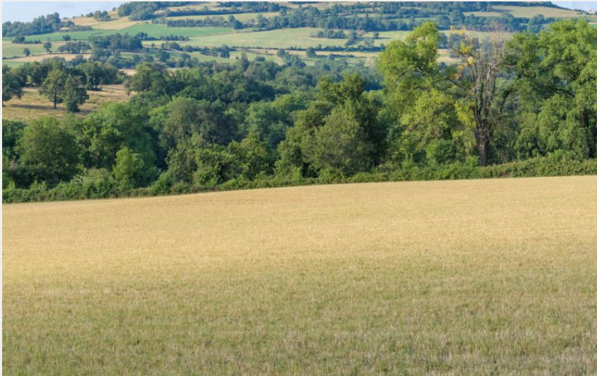
Le volcan de la Vergueur - St-Just-Près-Brioude (Jérémié Mazet)