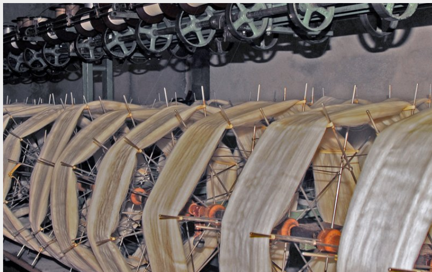
Moulinage (Michel Cros)