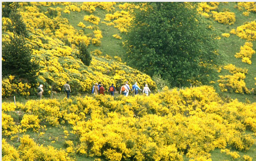
Randonneurs à Riotord