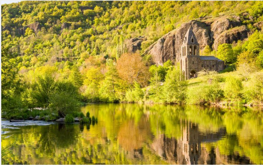
Sainte-Marie-Des-Chazes (Jérémy Mazet)