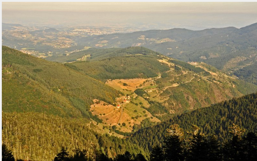
Vue au couchant depuis le Grand Felletin (Christian Bertholet)