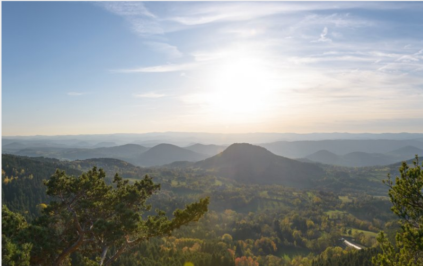
Coucher de soleil sur le Velay (J Mazet)