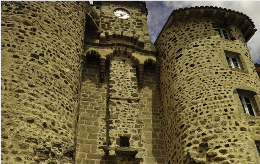
La Porte Monsieur (N Dutrany)